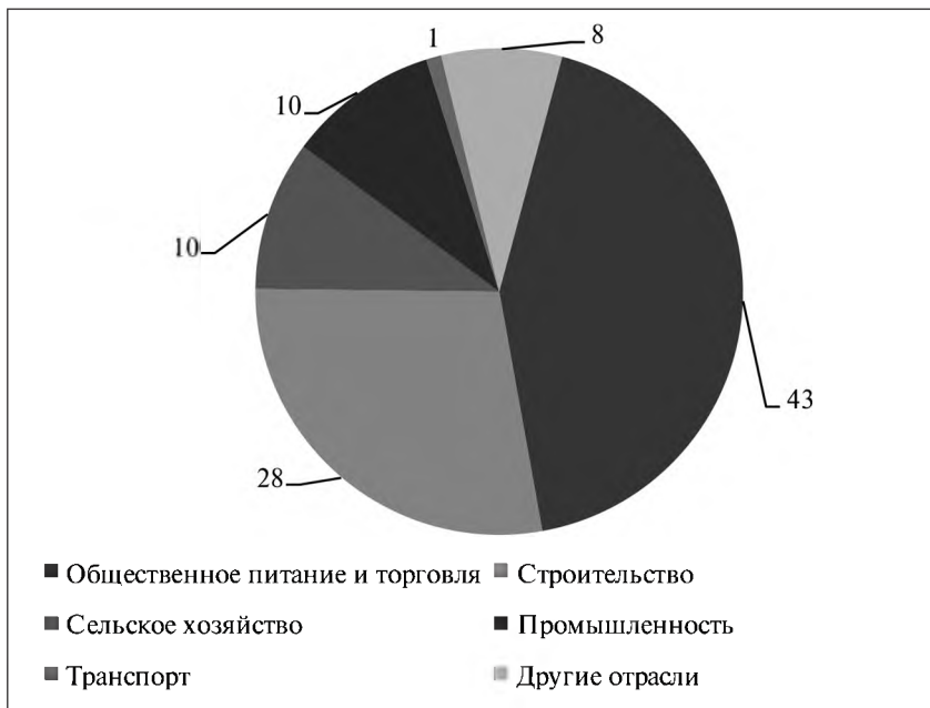
Рис. 2. Диаграмма использования иностранных граждан в отраслях народного хозяйства

Анализируя данные миграционной статистики и службы занятости, наблюдаем значительный прирост иностранной рабочей силы, однако, низкая квалификация и сложности социальной адаптации не способствуют улучшению качества производимых работ. Исследования, приведенные в данной работе, направлены на поиск решений данной проблемы при участии учреждений среднего и высшего образования.