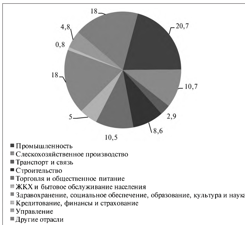
Рис. 1. Потребность в квалифицированных рабочих и служащих

В целом структура привлечения иностранной рабочей силы по сферам деятельности (рис. 2), распределяется следующим образом, основная часть (43%) заняты в общественном питании и торговле, 28% – в строительстве, 10% – в сельском хозяйстве, 10% – в промышленности, 1% – в транспорте, 8% – в других отраслях народного хозяйства [1, 8].