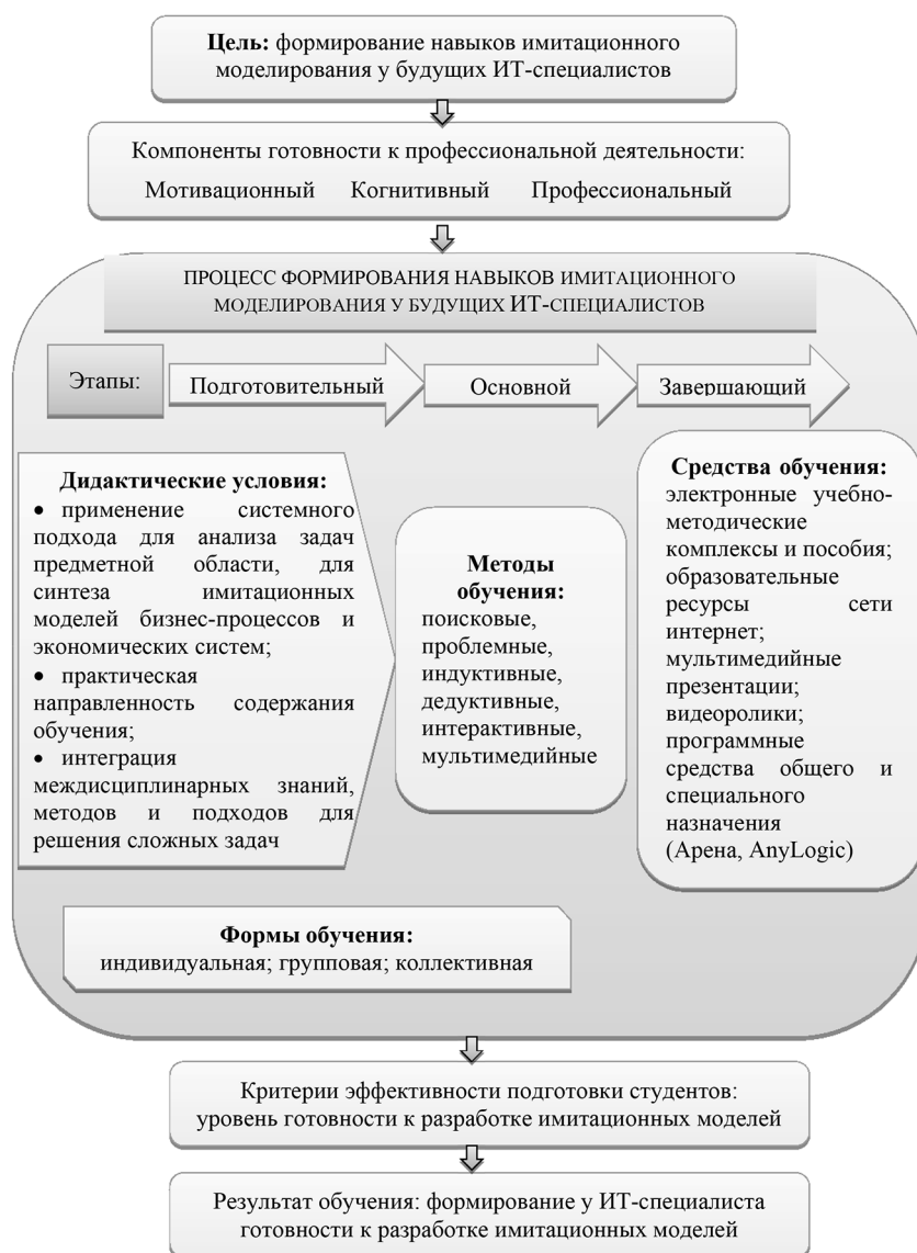
Рис. 1. Модель формирования готовности ИТ-специалиста к разработке имитационных моделей экономических процессов и систем

учения: лекции, лабораторные работы, задачи с проблемными ситуациями, мозговой штурм, творчески-поисковую деятельность, дистанционные формы на основе технологии Moodle. Все учебно-методические материалы дисциплины доступны студентам на образовательном портале вуза, там же реализованы и такие интерактивные формы работы, как форумы, Вики-документы, тесты по разделам, практические задания, куда обучаемые могут выкладывать свои работы и модели для проверки. Особое внимание мы уделяем и специализированным программным средствам имитационного моделирования. В на-