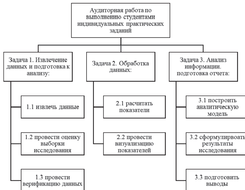
Рис. 1. Этапы выполнения практикума студентами

В практическом обучении методам извлечения и анализа данных социальных сетей можно выделить три последовательных этапа (задачи) ин-