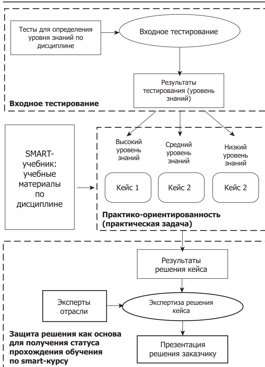
Рис. 2. Схема процесса SMART-обучения на основе решения кейсовых заданий и последующего изучения теоретического материала

меняются быстрее, чем маркетинг успеваеt адаптироваться к ним и предлагать адекватные запросам потребителей технологии. Сегодня для отрасли маркетинга в социальных медиа проблема актуальности информации стоит особенно остро, поскольку сами социальные медиа являются сильнейшим генератором информации о себе самой. В этой связи возникает задача сделать электронное обучение не просто мобильным, но и адаптированным к современному ритму и темпу жизни: поддержка любых мобильных устройств с возможностью синхронизации результатов обучения.