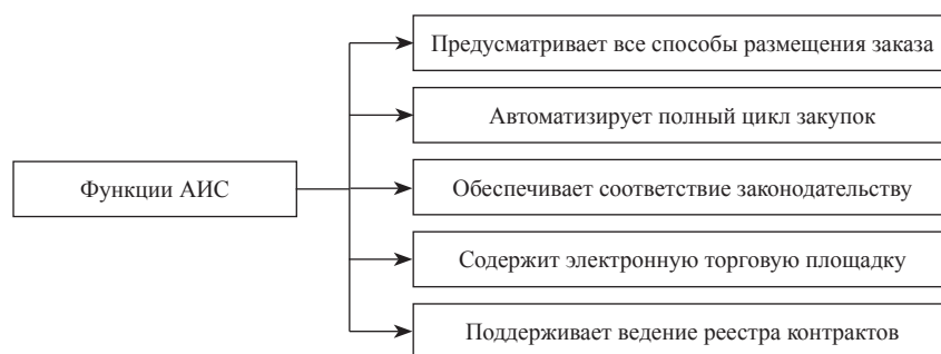
Рис. 1. Функции современных АИС

10. АИС должна позволять осуществлять мониторинг исполнения и эффективности реализации закупочной деятельности с различным временным интервалом, т.е. фор-